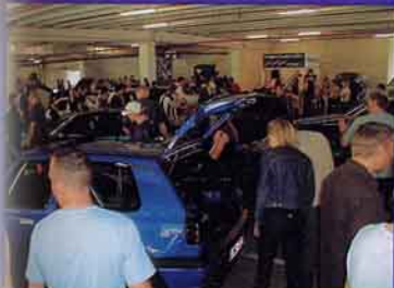
Die Autoshow kam gut an