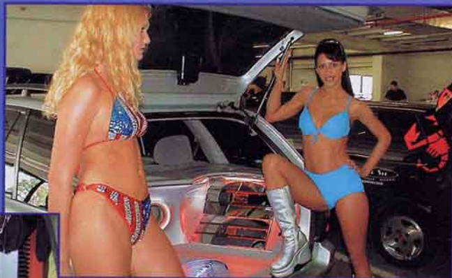
D&W Girls heizten die Stimmung an