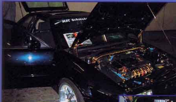
Goldiger VR6 Corrado