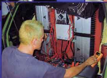
Steilheck-Polo mit viel Dampf